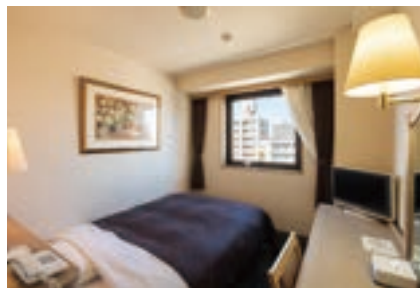
デラックスシングルルーム