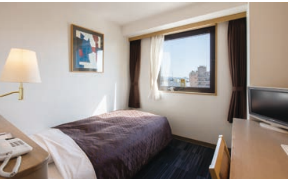
スタンダードシングルルーム