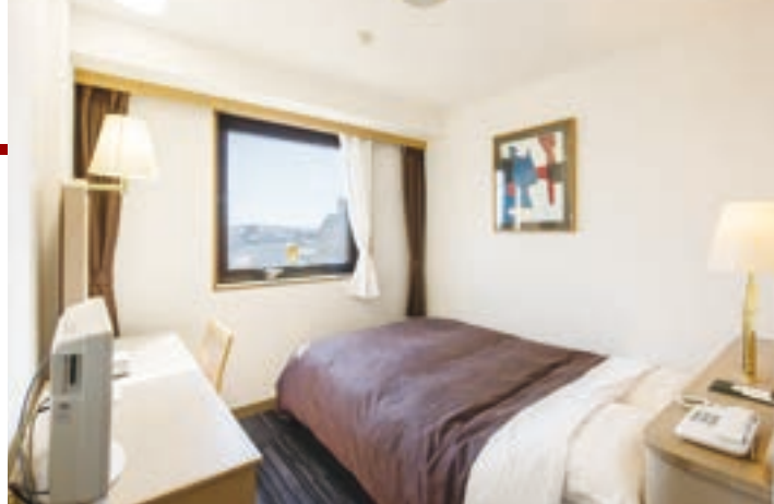
エコミナーダブルルーム