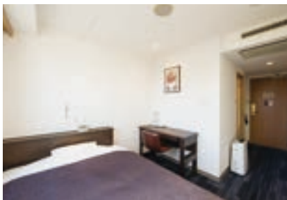
エクストラシングルルーム